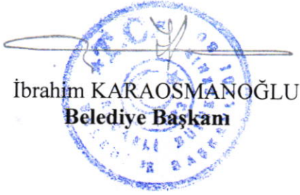
İbrahim KARAOĞLU Belediye Başkanı